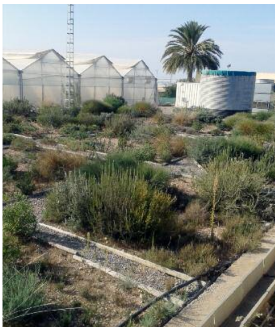
Figura 4. Vista del bosque-isla establecido en Las Palmerillas.

las plagas, y hay evidencias de que mejoran el control biológico en los campos de cultivo adyacentes (Holland, 2012).