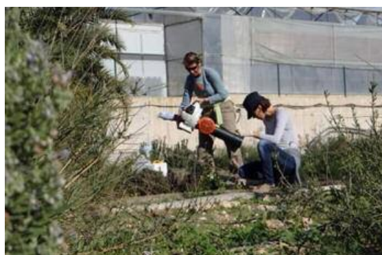
Figura 6. Muestreo de la artropodofauna.

diferente disponibilidad de espacio entre los invernaderos. Esta parcela es actualmente visitable, por lo que se invita a todas aquellas personas interesadas a venir a la Estación Experimental a conocer in situ el proyecto y las características de las plantas que en este momento son objeto de estudio. La idea es diseñar setos a la carta. Esperamos que estas actuaciones tengan un efecto beneficioso sobre la dinámica poblacional de los enemigos naturales de las plagas, reduciendo así la presión de los mismos sobre los cultivos, contribuyendo así al desarrollo de una agricultura más respetuosa y sostenible. /