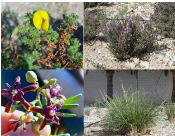
Figura 3. Detalle de las flores de algunas plantas del insectario.