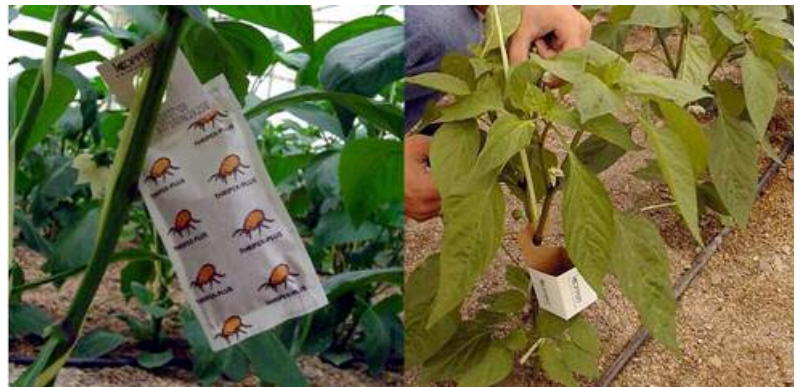
Figura 1. Métodos de suelta de fauna auxiliar en los invernaderos.

El potencial para el control de las plagas mediante la fauna auxiliar debe, por tanto, relacionarse con nuestra habilidad para ejercer algún tipo de control sobre el hábitat cercano a las zonas de producción. Por ello, en la Estación Experimental de Cajamar Caja Rural Las Palmerillas, junto con la Estación Experimental del Zaidín (Csic) llevamos una línea de investigación que pretende determinar qué plantas autóctonas pueden servir como refugio de artrópodos beneficiosos, actuando como barreras fitosanitarias y contribuyendo a una importante