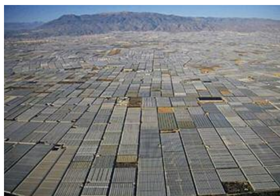
Figura 2. Mar de plástico del poniente de Almería.

En otros países proponen el establecimiento de márgenes con flores de especies herbáceas anuales no autóctonas. En nuestras condiciones estos márgenes requieren un mantenimiento constante, riego, abonado y su plantación año tras año. Lo novedoso de nuestra propuesta es el empleo de plantas autóctonas, totalmente adaptadas a nuestras condiciones de clima y suelo. La necesidad de estudio viene dada porque no todas las plantas contribuyen de igual manera en la consecución de este objetivo, ya que algunas especies vegetales pueden promover la presencia de plagas o actuar como reservorio de los principales virus que afectan a los cultivos. La selección de plantas que componen estas infraestructuras ecológicas debe ser, por tanto, un primer paso de vital importancia. Los criterios de selección más importantes utilizados para identificar qué plantas pueden ser potencialmente útiles para atraer y mantener a los enemigos naturales clave de las plagas hortícolas en el poniente almeriense son los siguientes: